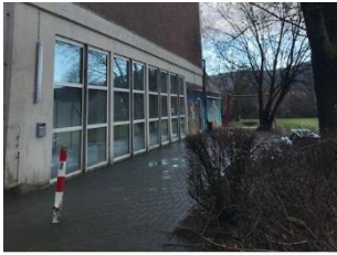
Turnhalle Am Hagenberg