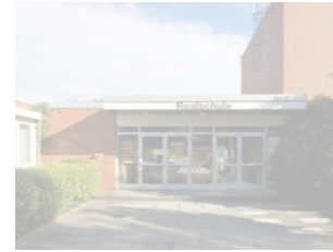
RS Bad Iburg