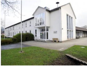
GS Am Hagenberg