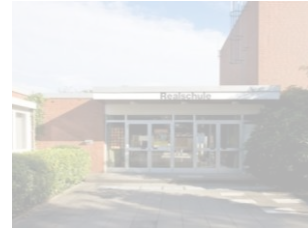
RS Bad Iburg